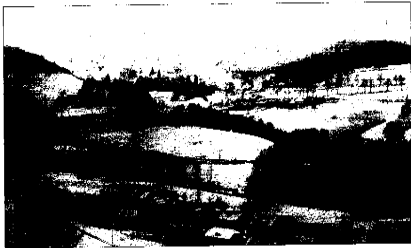
Schwierige Topographie: In Wieden wird zur Zeit ein WLAN-Netz installiert, das einen schnellen Zugang zum Internet ermöglichen soll. Doch die Funktechnik hat ihre Tücken.